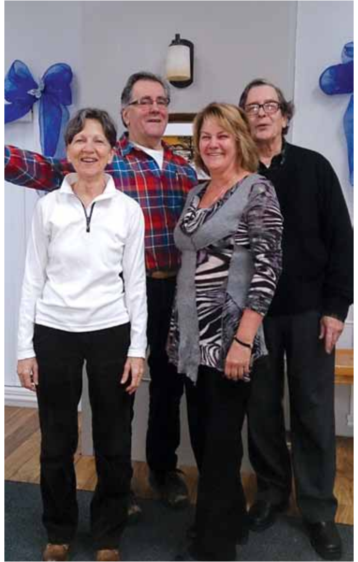
Absente de la photo : Nicole Côté